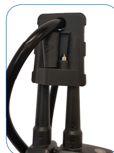
Schutzkappe mit Aufnahmefach für Metallhülsen